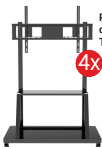
Podstawa do monitora TECHly TR30