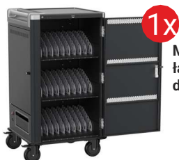
Mobilna stacja ładująca EWENT dla 30 laptopów