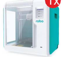
Drukarka 3D robo E3