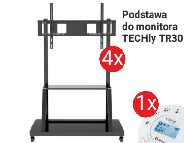
Podstawa do monitora TECHly TR30