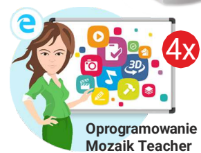
Oprogramowanie Mozaik Teacher