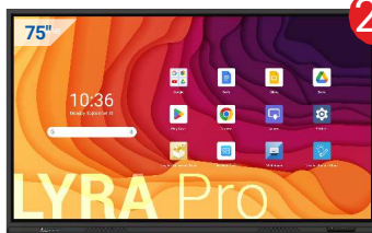
Monitor interaktywny LYRA Pro