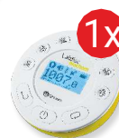
Dysk pomiarowy Labdisc Biochem

Całkowita wartość zadania (wnioskowana kwota wsparcia finansowego plus wkład własny – suma wkładu finansowego i rzeczowego) wraz z procentowym udziałem dotacji i wkładu własnego