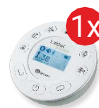
Dysk pomiarowy Labdisc Fizyka