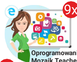
Oprogramowanie Mozaik Teacher