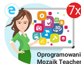
Oprogramowanie Mozaik Teacher

Całkowita wartość zadania (wnioskowana kwota wsparcia finansowego plus wkład własny – suma wkładu finansowego i rzeczowego) wraz z procentowym udziałem dotacji i wkładu własnego