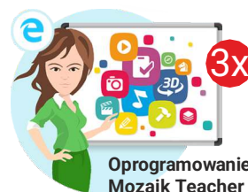
Oprogramowanie Mozaik Teacher