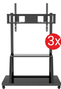
Podstawa do monitora TECHly TR30