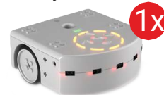
Robot edukacyjny Thymio RF