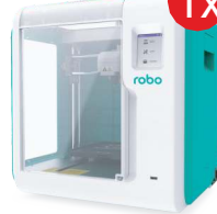
Drukarka 3D robo E3