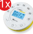
Dysk pomiarowy Labdisc Biochem