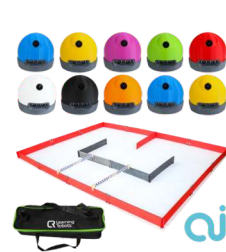
Zestaw AlphaAI Class Pack