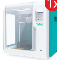
Drukarka 3D robo E3