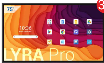
Monitor interaktywny LYRA Pro