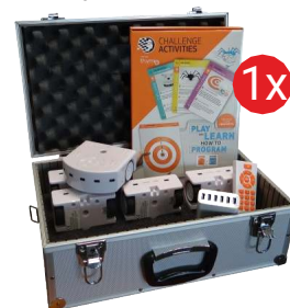
Zestaw szkolny Thymio RF